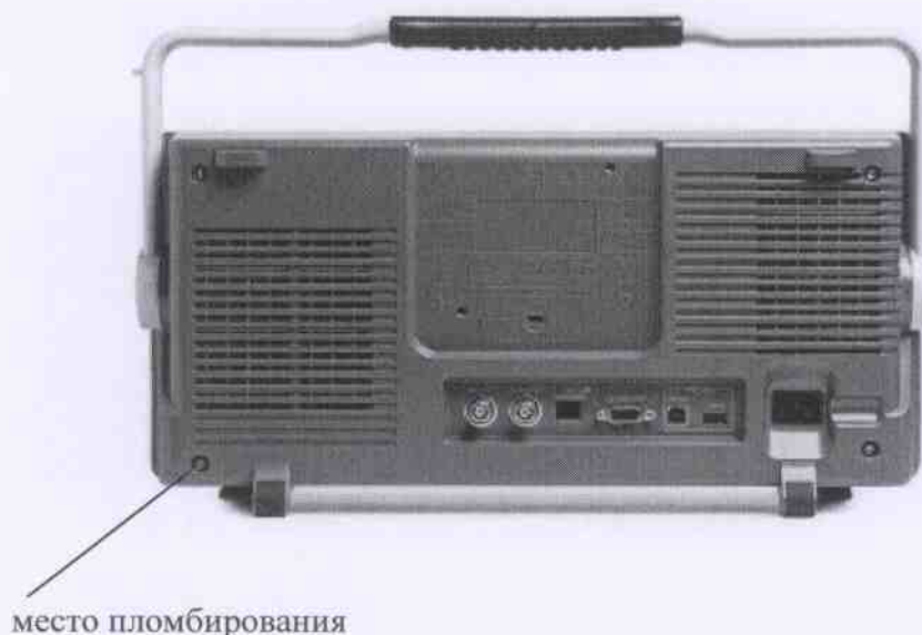
фотография 2 – вид сзади

По условиям эксплуатации осциллографы-анализаторы спектра MDO3012, MDO3014, MDO3022, MDO3024, MDO3032, MDO3034, MDO3052, MDO3054, MDO3102, MDO3104 соответствуют группе 3 ГОСТ 22261-94.